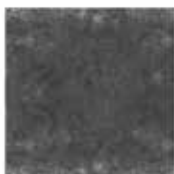
9 MATT DIBBETS TAPPETO CM 500X400