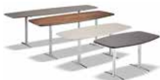
8 WILSON CONSOLLE CM 180X50 H55