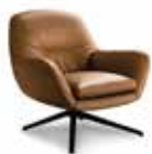
4 JENSEN POLTRONA CM 81X85 H78